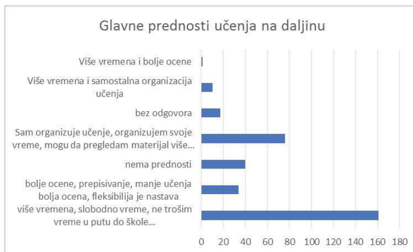
График 2. Предности учења на даљину из перспективе ученика Средњих школа у Србији

Као главне предности „on-line“ учења на даљину, чак 47,5% ученика је истакло више слободног времена, а 22% испитаника као предност наводи слободу да управљају својим временом и сами организују учење, График 2.