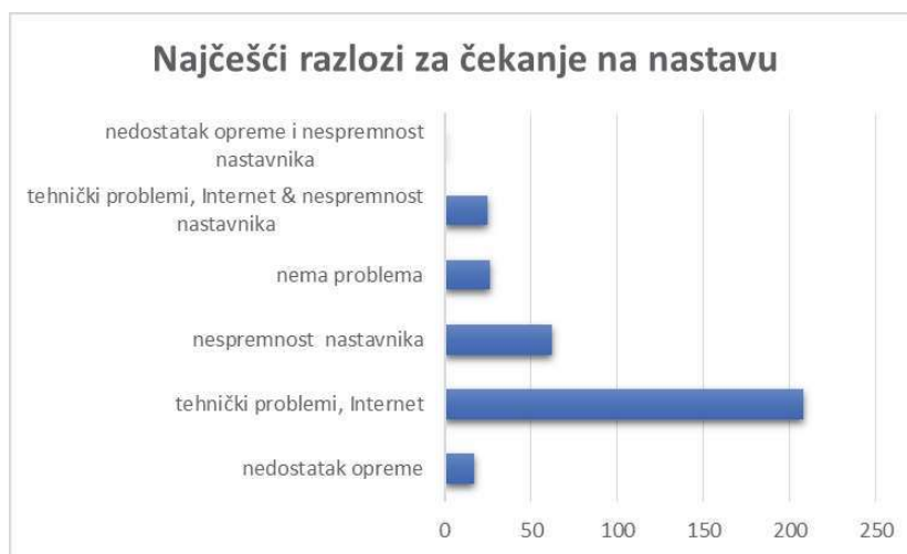
График 1. Најчешћи разлози за чекање на почетак наставе

Као главне предности „on-line“ учења на даљину, чак 47,5% ученика је истакло више слободног времена, а 22% испитаника као предност наводи слободу да управљају својим временом и сами организују учење, График 2.