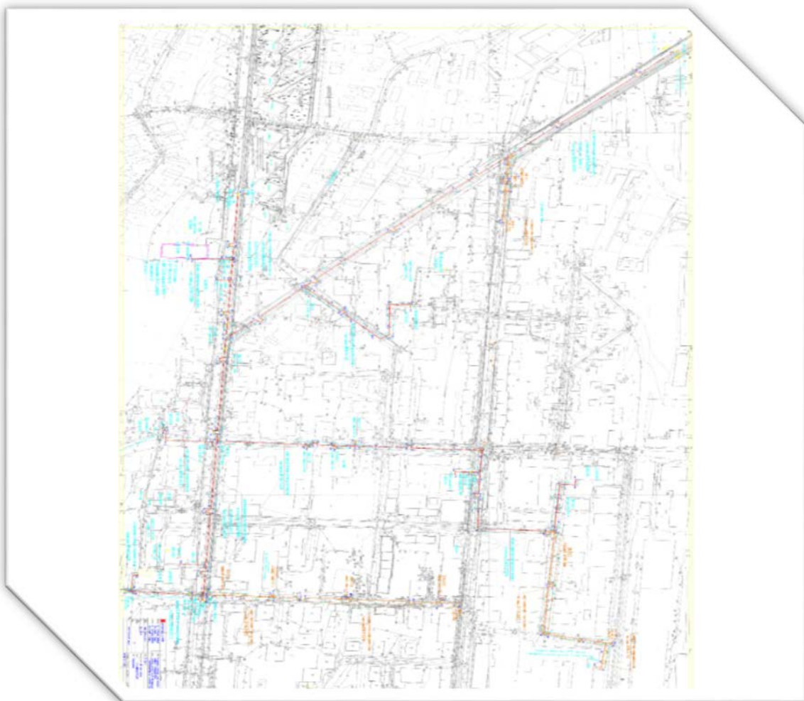
Slika 4 Trasa toplovodne mreže GP Karaburma – Dunav

Izgradnjom novog predizolovanog toplovoda stekli su se uslovi za gašenje još 8 kotlovnih postrojenja na Karaburmi, od kojih pet koristile mazut kao gorivo i tri koriste ugalj i briket. Sledeće kotlarnice su u planu gašenja kotlarnica za leto 2017 godine: