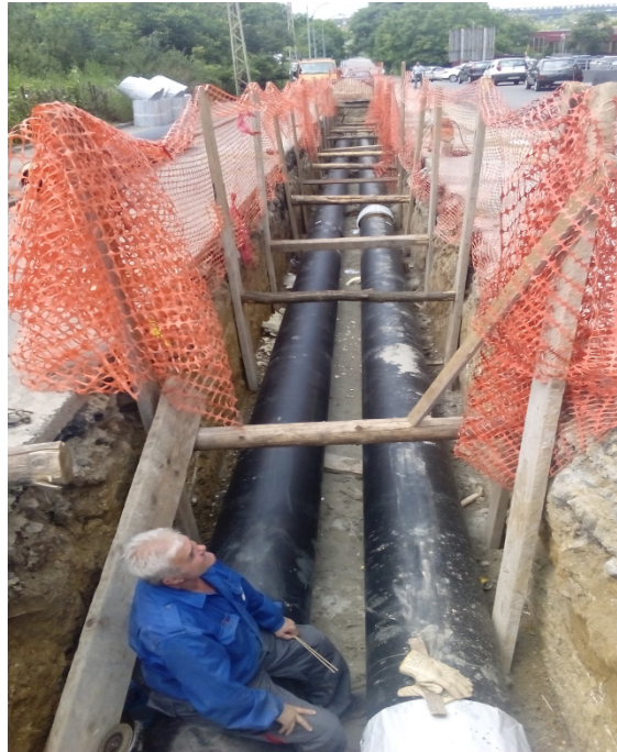
Slika 1 Izgradnja toplovoda duž ulice Vojvode Micka Krstića

Trasa novog toplovoda kreće se ulicama Mije Kovačevića, Višnjička, Vojvode Micka Krstića, Marijane Gregoran, njegovom izgradnjom stvorili su se uslovi za gašenje većeg broja blokovskih i individualnih kotlarnica na Karaburmi, kao i uslovi za priključenje novih korisnika na sistem „Beogradskih elektrana”. Nakon završenih radova korisnici će dobiti kvalitetnije i sigurnije snabdevanje toplotnom energijom, a građani Beograda kvalitetniju životnu sredinu. Na slici 1 je prikazana izgradnja toplovoda u ulici Vojvode Micka Krstića.