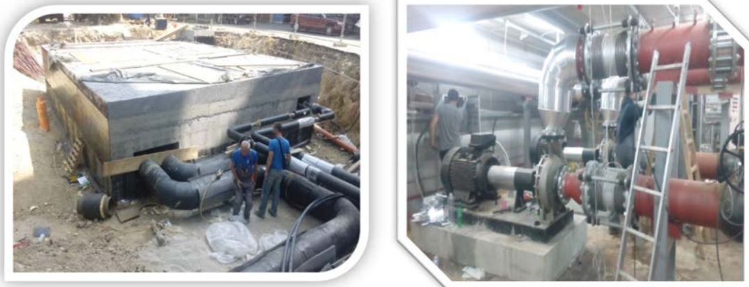
Slika 2 Izgradnja prepumpne stanice

Ukupna dužina toplovoda od toplane Dunav do trenutno najudaljenije toplotne podstanice Ural-ska 36 na Karaburmi iznosi 6045 m, a vreme koje je potrebno da se toplotna energija prenese ovom trasom iznosi 217 min. Upravo to je predstavljalo ozbiljan problem na početku grejne sezone, koji se ogledao kašnjenjem početka grejanja. Naime, sa signalom za početak grejanja, kombinovani ventil na toplotnoj podstanici dobija signal za otvaranje čime počinje cirkulacija kroz toplotnu podstanicu, međutim cirkulacija kroz ceo krak toplovoda od toplane „Dunav“ do Karaburme nije bilo sve dok se ne otvore kombinovani ventili na toplotnim podstanicama.